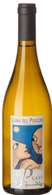
“Luna sul Poggio” Gavi DOCG del Comune di Gavi

White and calcareous soil: fresh, clear and pure, it tells his story best when young