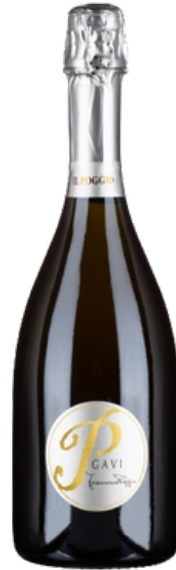
“Francesca Poggio” Gavi DOCG del Comune di Gavi Rovereto Spumante Metodo Classico

The hill that represents the maximum expression of the Gavi crus: clayey soils with the presence of stones, altitude of 330 m above sea level with east-west exposure