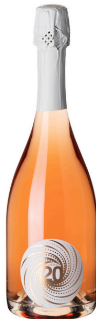
“La Rosa dei 20”

At sight, a play of veils that covers a seductive body, gentle and generous bubbles that smell of bread crust, yeast and citrus fruits.