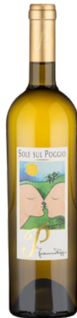
“Sole sul Poggio” Gavi DOCG del Comune di Gavi Rovereto

Concentrates the most typical expressions of the Cortese vine: versatile, good in youth, it rests very well for a few years in the cellar