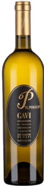
“Etichetta Nera” Gavi DOCG del Comune di Gavi Rovereto

La collina che rappresenta la massima espressione dei cru di Gavi: terreni argillosi con presenza di pietre, un’altitudine di 330 m slm con esposizione est-ovest