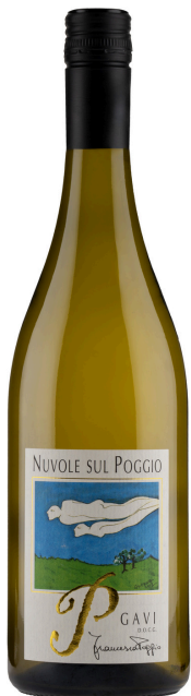
“Nuvole Sul Poggio” Gavi DOCG

Terre bianche e calcaree: fresco, limpido e puro, si racconta bene quando è giovane