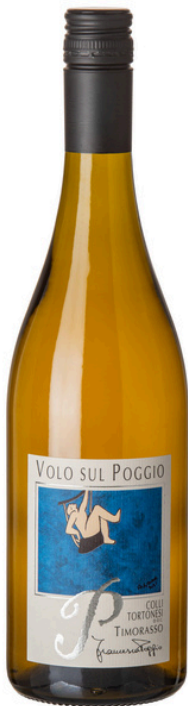
“Volo sul Poggio” Colli Tortonesi DOC Timorasso

Dalla riscoperta in un antico vitigno un vino intenso, persistente, costante, di lunga durata, al naso frutta matura e idrocarburi