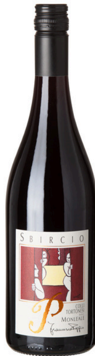
“Sbirccio” Colli Tortonesi DOC Monleale

From the rediscovery in an ancient vine of an intense, persistent, constant, long-lasting wine, ripe fruit and hydrocarbons on the nose.